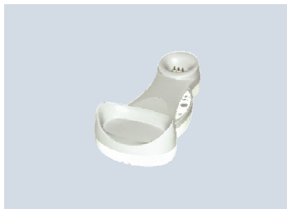
OM - Gryphon™